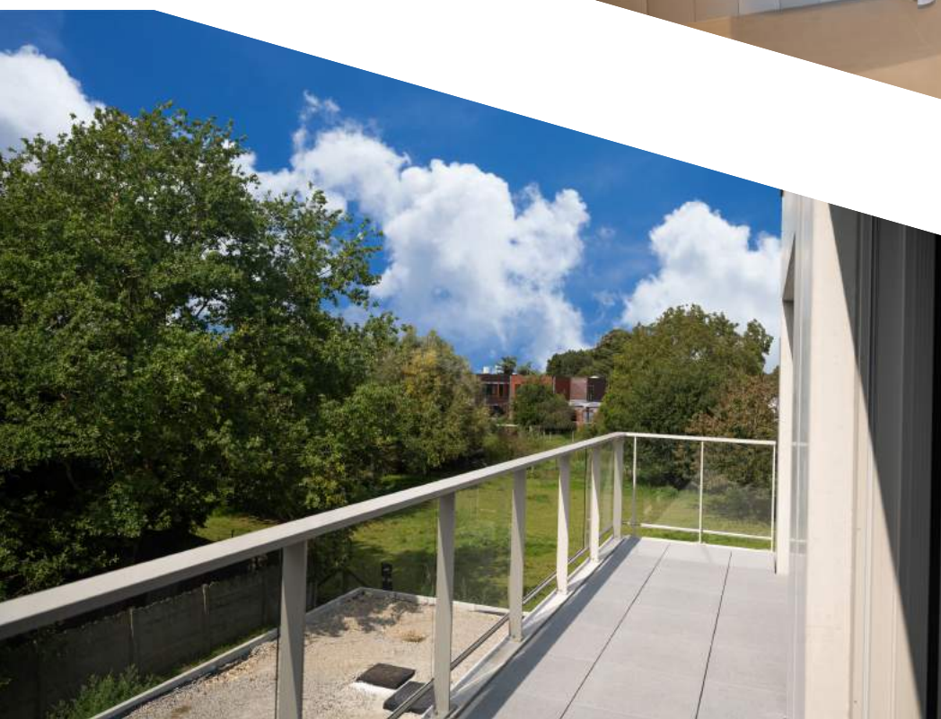
Met terras en uitzicht