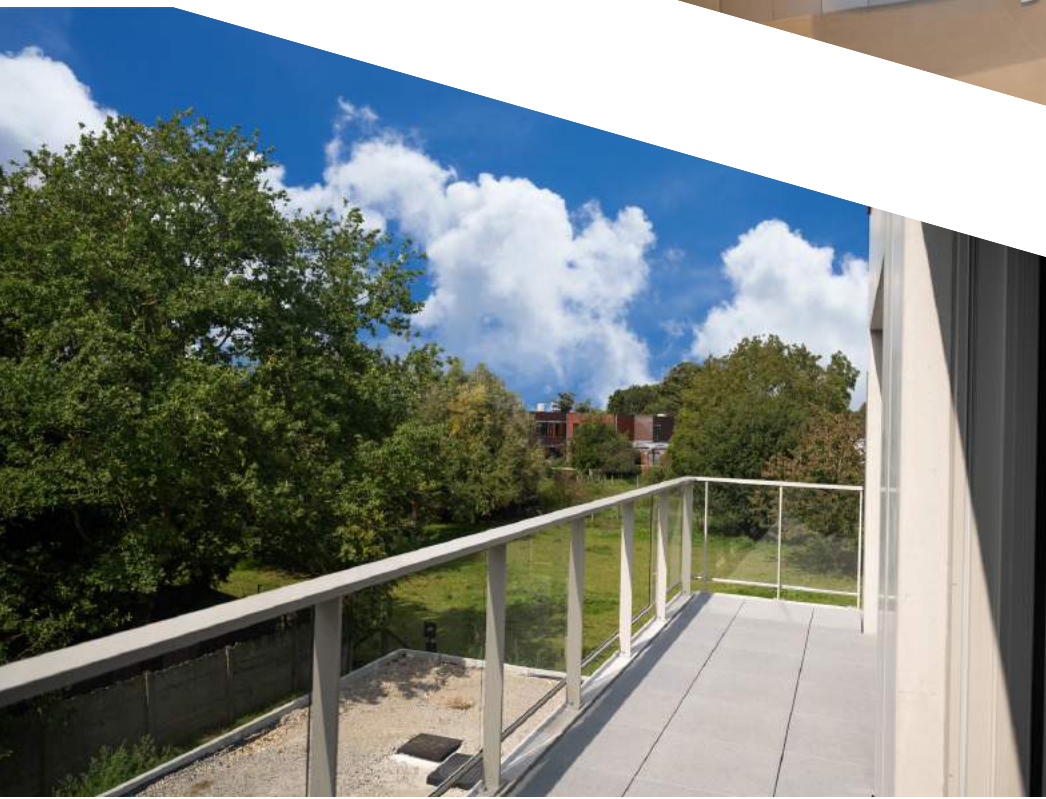
Met terras en uitzicht