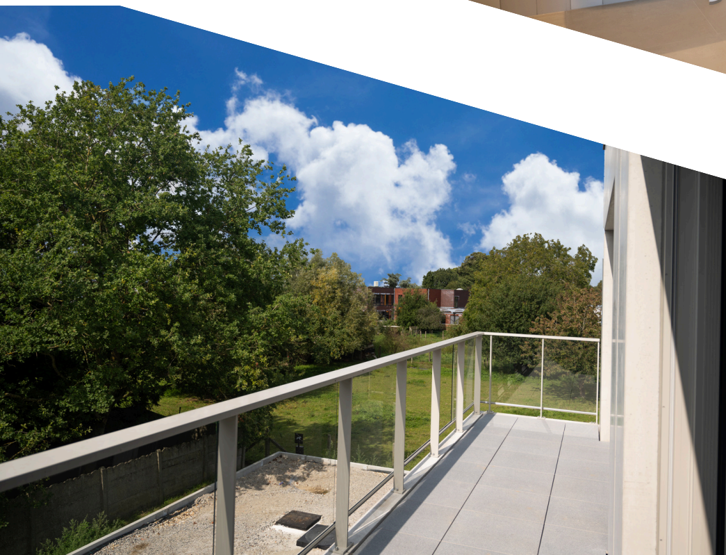
Met terras en uitzicht